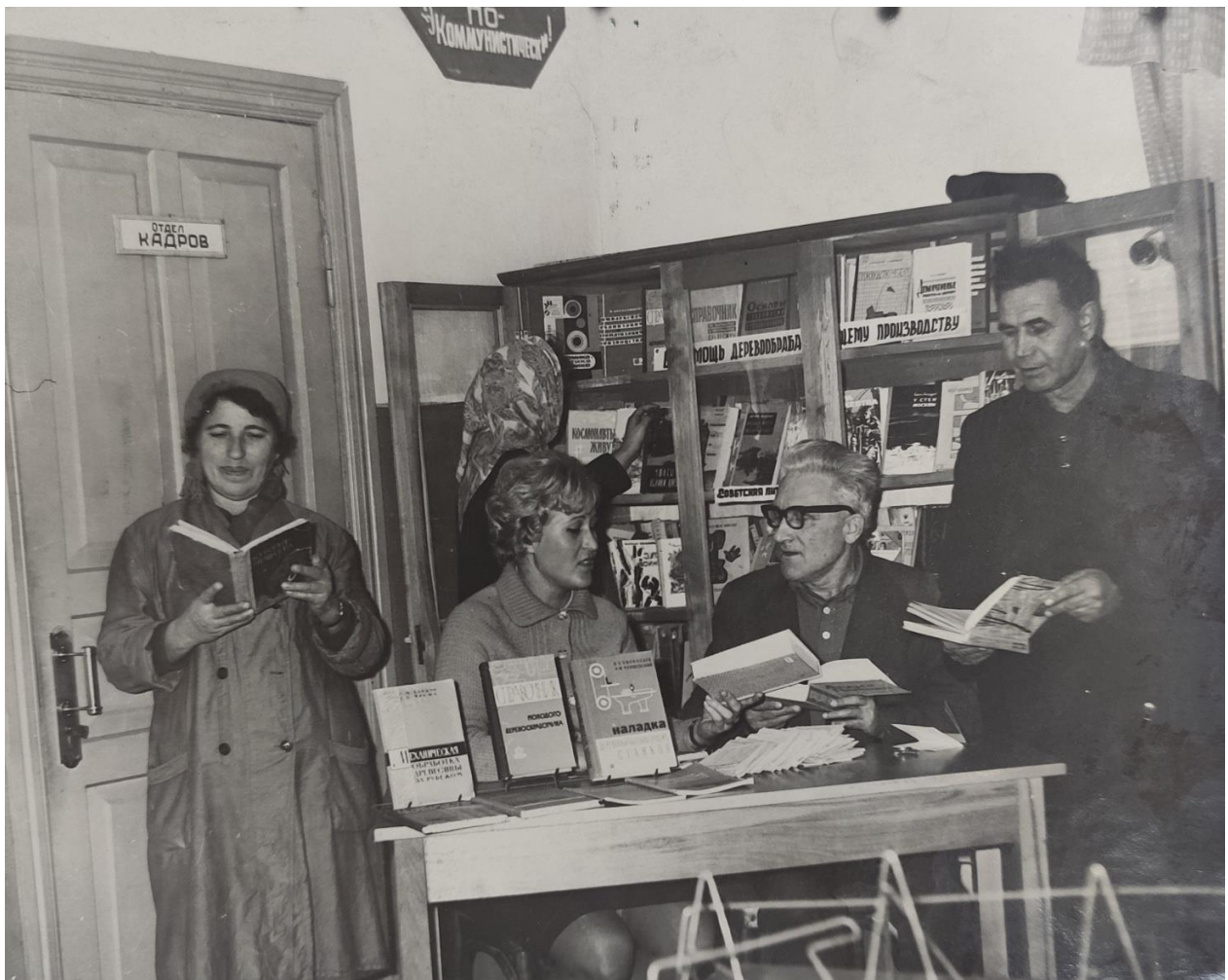
Фото 17. Пункт выдачи книг. Пашковский лесокombинат. 1960-е гг.