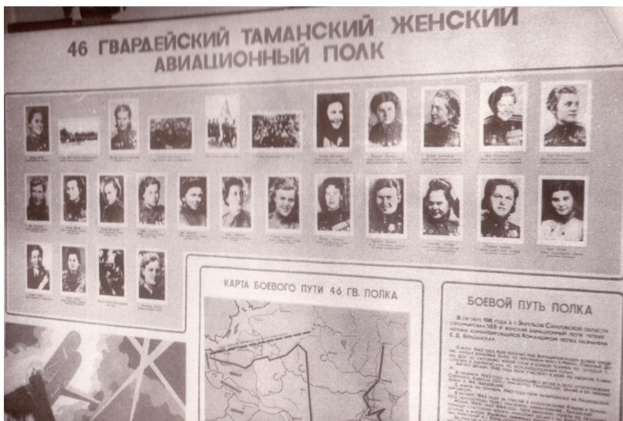
Фото 24. Стенд, рассказывающий о подвиге 46-го гвардейского Таманского женского авиаполка (подробнее с историей полка вы сможете познакомиться на сайте МУК ЦБС города Краснодара, в разделе «Виртуальный музей»: http://www.neklub.kubannet.ru/index.php/informatsionnye-resursy/forum1 )