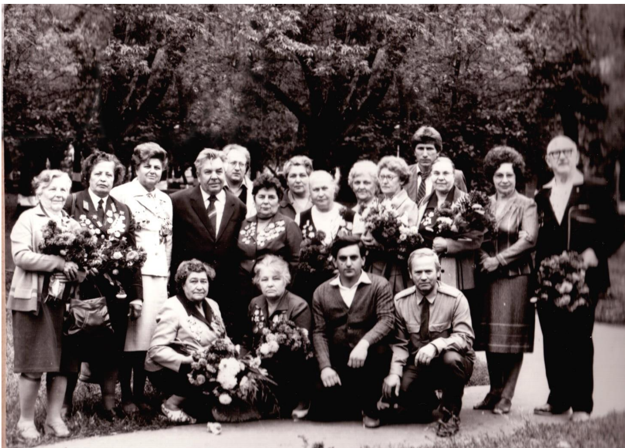
Фото 23. Встреча читателей Библиотеки им. Н. А. Добролюбова с летчицами 46-го гвардейского Таманского женского авиаполка. 1970-е гг.