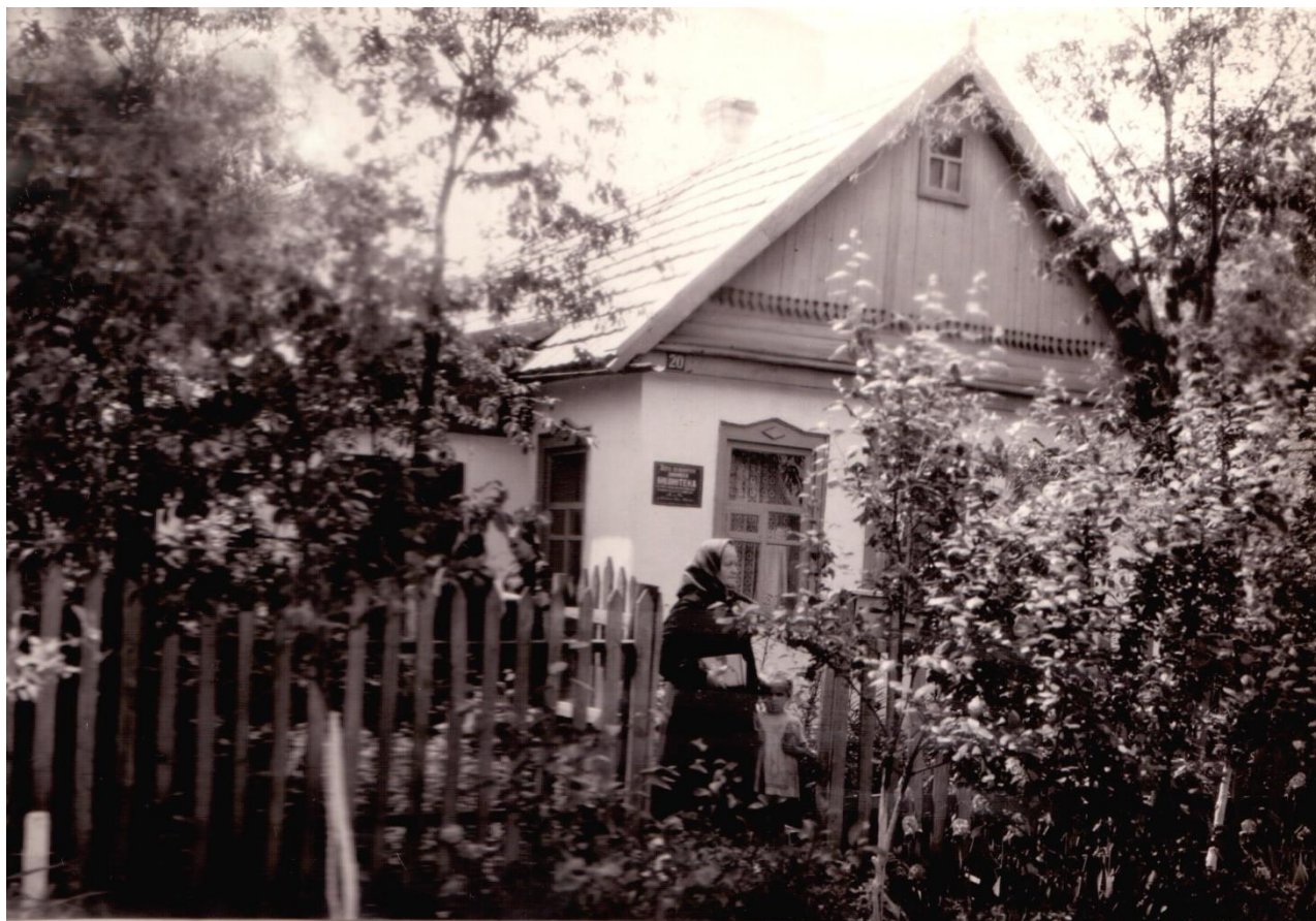
Фото 19. Домовая библиотека № 1. 1960-е гг.