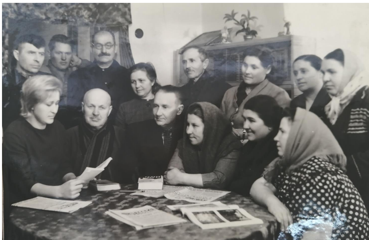
Фото 20. В домовой библиотеке. 1960-е гг.