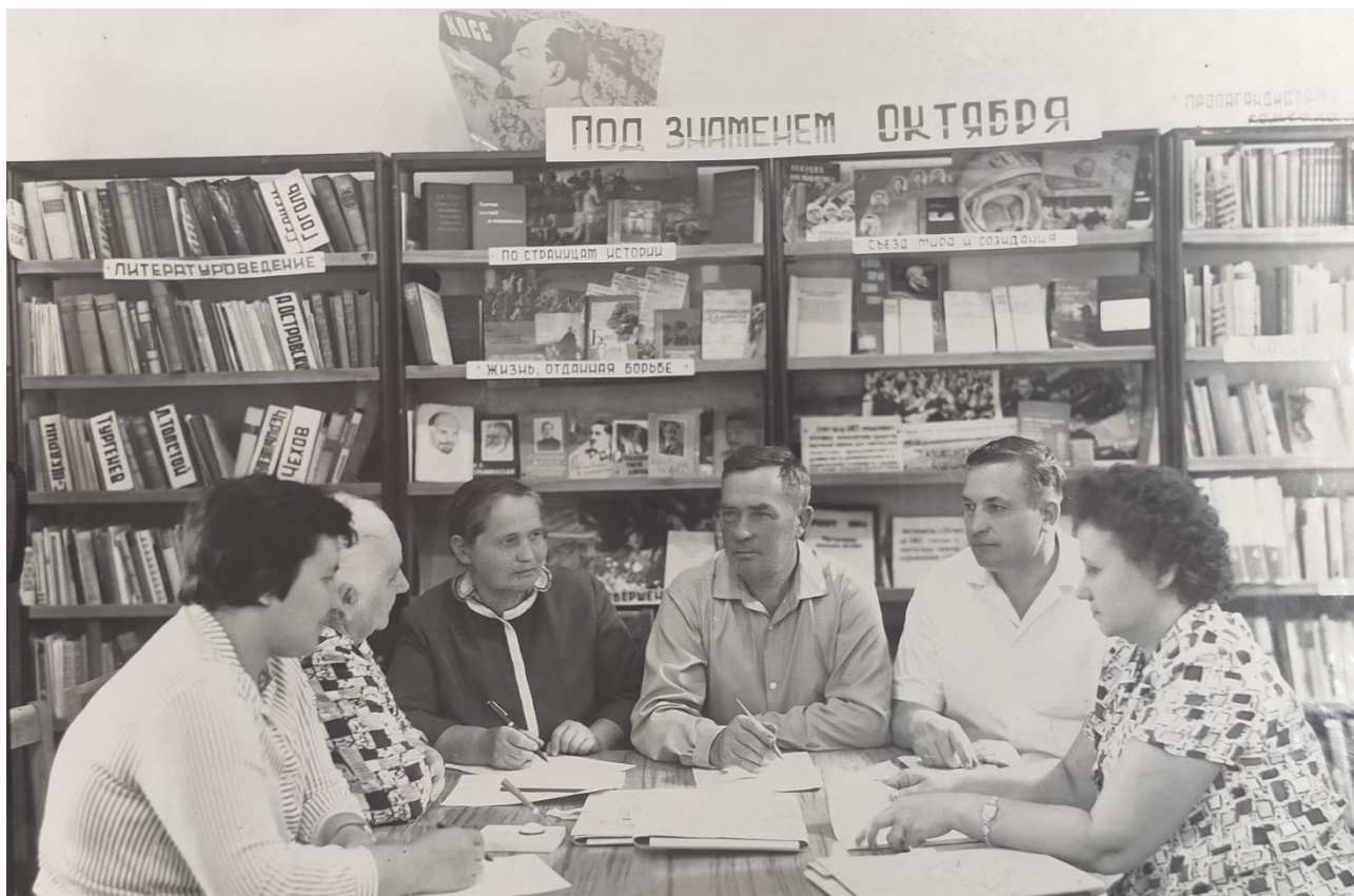
Фото 13. Совет библиотеки обсуждает план работы по читательской конференции «Дорогой отцов». 1960-е гг.