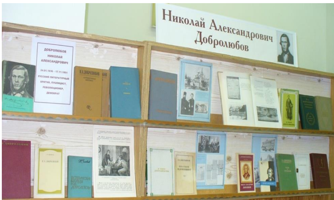
Фото 46. Выставка, посвященная жизни и творчеству Н. А. Добролюбова. 2015 г.