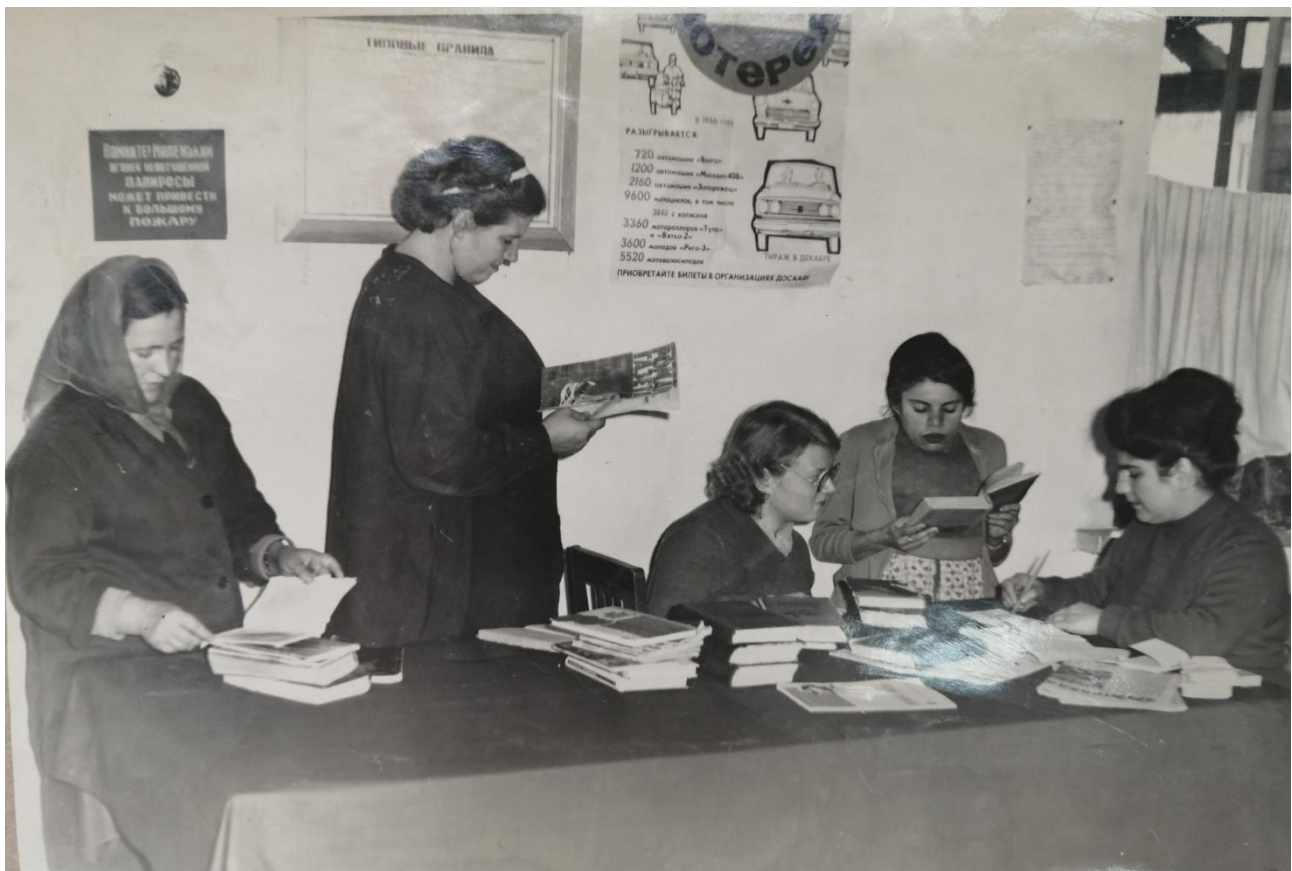
Фото 16. Пункт выдачи книг. Фабрика бытовых изделий. На производственном участке. 1960-е гг.