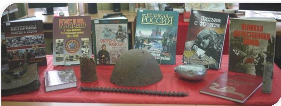
Фото 50. Экспозиция, посвященная Великой Отечественной войне, 2019 г.