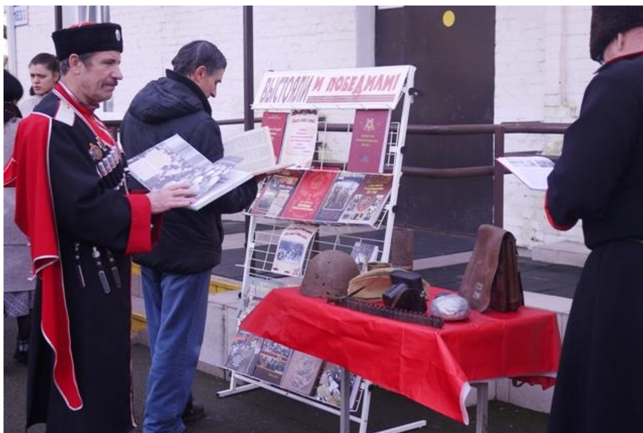
Фото 47. Книжно-предметная выставка «Выстояли и победили», посвященная 76-летию со дня освобождения города Краснодара от немецко-фашистских захватчиков. 2019 г.