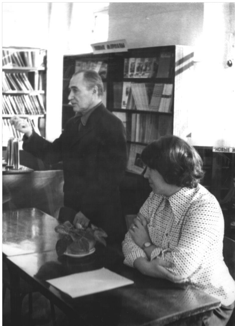
Фото 21. Встреча с писателем Ю. Сальниковым. Обсуждение повести «Джемпер с синими елками». 1970-е гг.