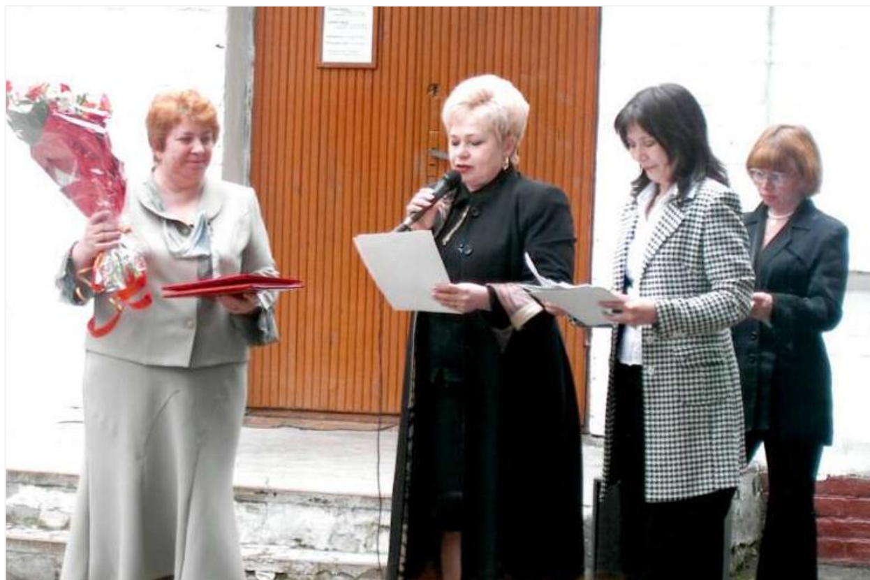
Фото 37. Празднование 70-летия Библиотеки им. Н. А. Добролюбова. 2006 г.