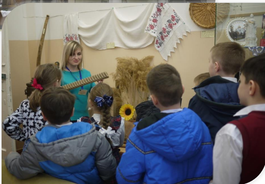
Фото 48–49. Мини-музей «Кубанская старина», 2019 г.